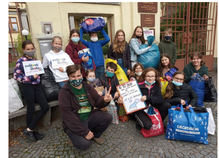
Žákovský tým ZŠ a MŠ Olomouc, Dvorského 33.

Ve školních letech 2019/2020 a 2020/2021 jsme provázeli patnáct škol na cestě za získáním či udržením titulu Světová škola. Tyto roky přinesly více výzev, než všichni očekávali. Udílení titulů Světová škola se z června přesunulo do listopadu a titul získaly ZŠ a MŠ Choryně a ZŠ a MŠ Olomouc, Dvorského 33.