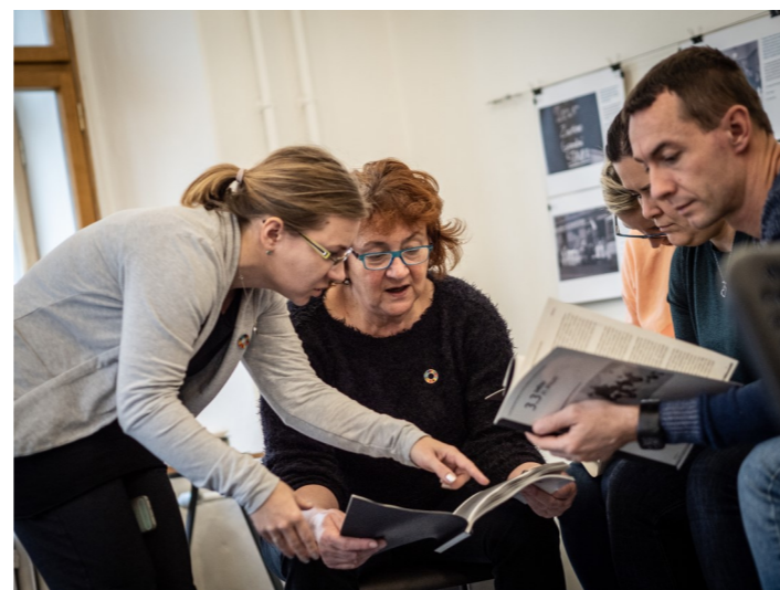
Seminář pro učitele ze zapojených škol. 8. 1. 2020.

V roce 2020 jsme pokračovali ve spolupráci s pedagogy a žáky z 10 škol. Pedagogové se vzdělávali na seminářích a předávali zkušenosti formou školení svých kolegů ve sborovnách. I přes pandemickou situaci žáci naplánovali a uskutečnili osvětové akce pro veřejnost v okolí své školy. Pro učitele jsme připravovali učebnici Světové dějiny lidstva včetně metodické příručky.