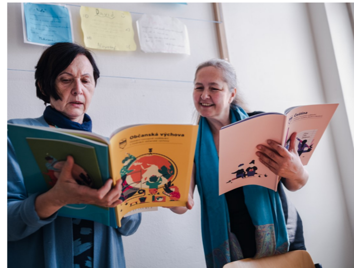
Metodické příručky. Autor: Dominika Gronowska

V roce 2020 jsme se věnovali především metodickým seminářům a webinářům se zaměřením na GRV v matematice, češtině a občanské výchově. K tomu vznikly tzv. Hodnotící nástroje pro výuku globálních témat. Předmětově zaměřený přístup ke GRV jsme představili například na našem kulatém stole pro aktéry ve vzdělávání nebo na veletrzích, konferencích či letních školách, do rukou pedagogů se tak dostalo 1 143 metodických příruček.