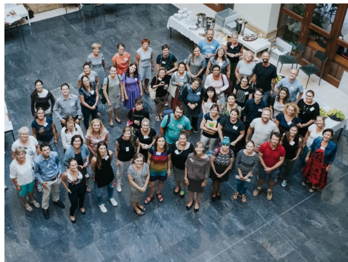
Zahájení konference „Učíme o globálních souvislostech VI.“, 25. 8. 2020, Umělecké centrum UP Olomouc.

Konference přilákala 59 učitelů a zástupců dalších vzdělávacích institucí.